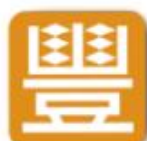
永豐銀行 (僅金融卡)