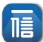
淡水一信 (僅金融卡)