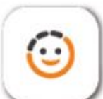
王道銀行 (僅金融卡)