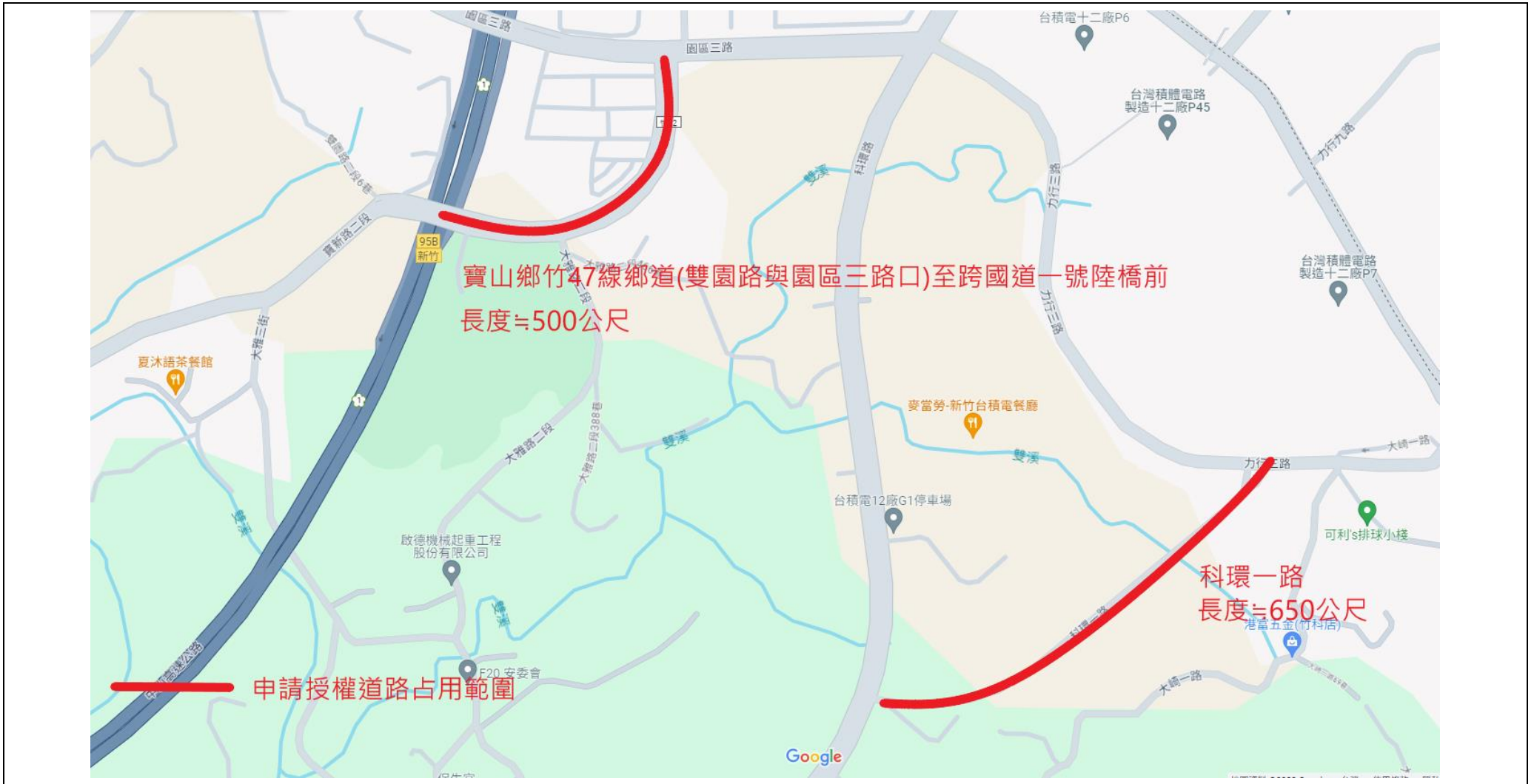
新竹科學園區寶山二期擴建計畫申請授權道路占用範圍道路圖說