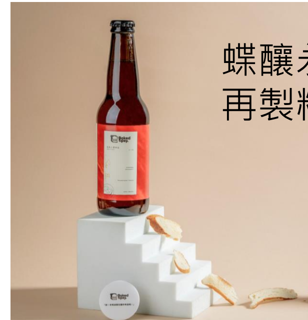
蝶釀永續 回收麵包再製精釀啤酒