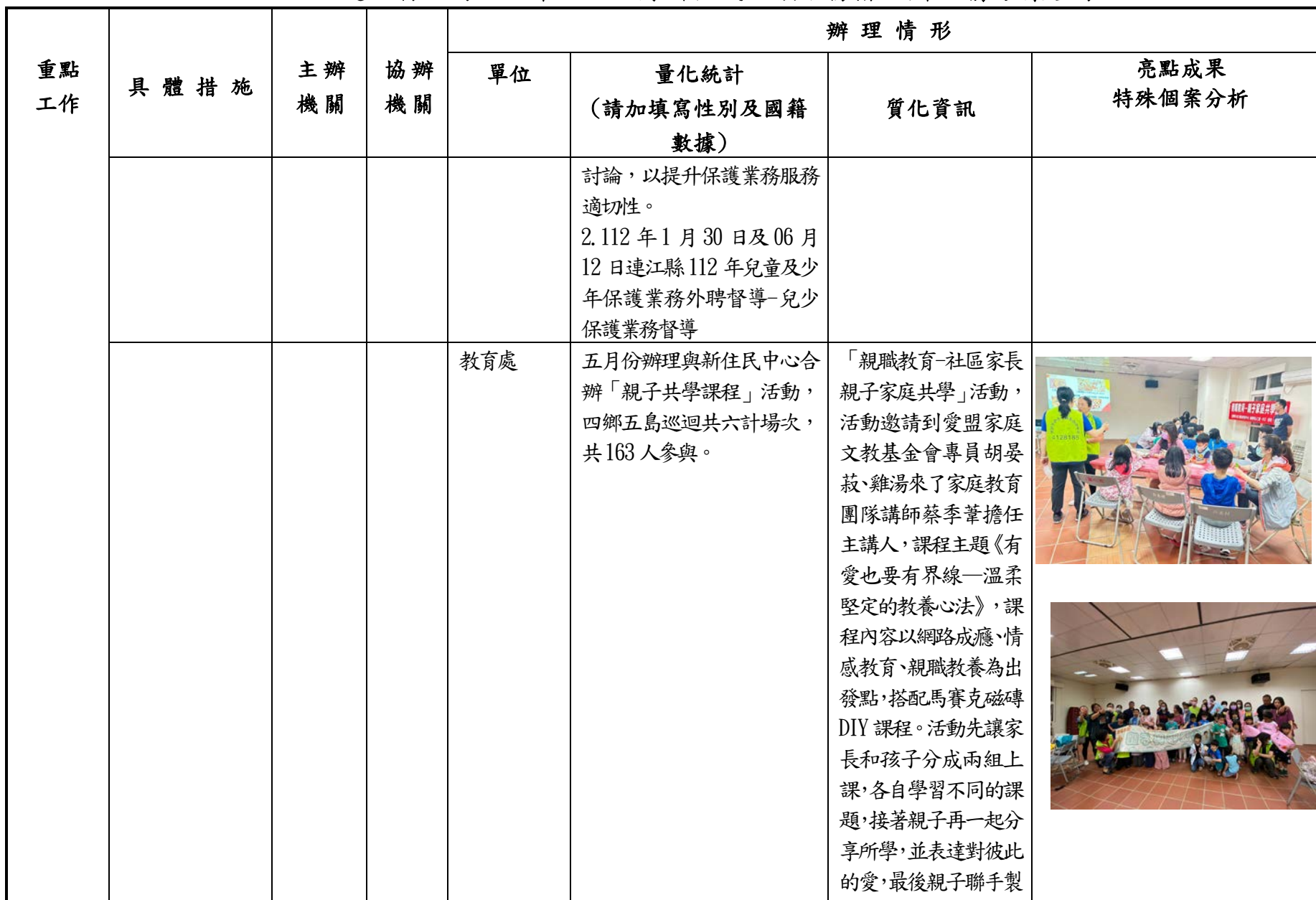
連江縣政府 112 年 1 至 6 月新住民照顧服務措施辦理情形彙整表