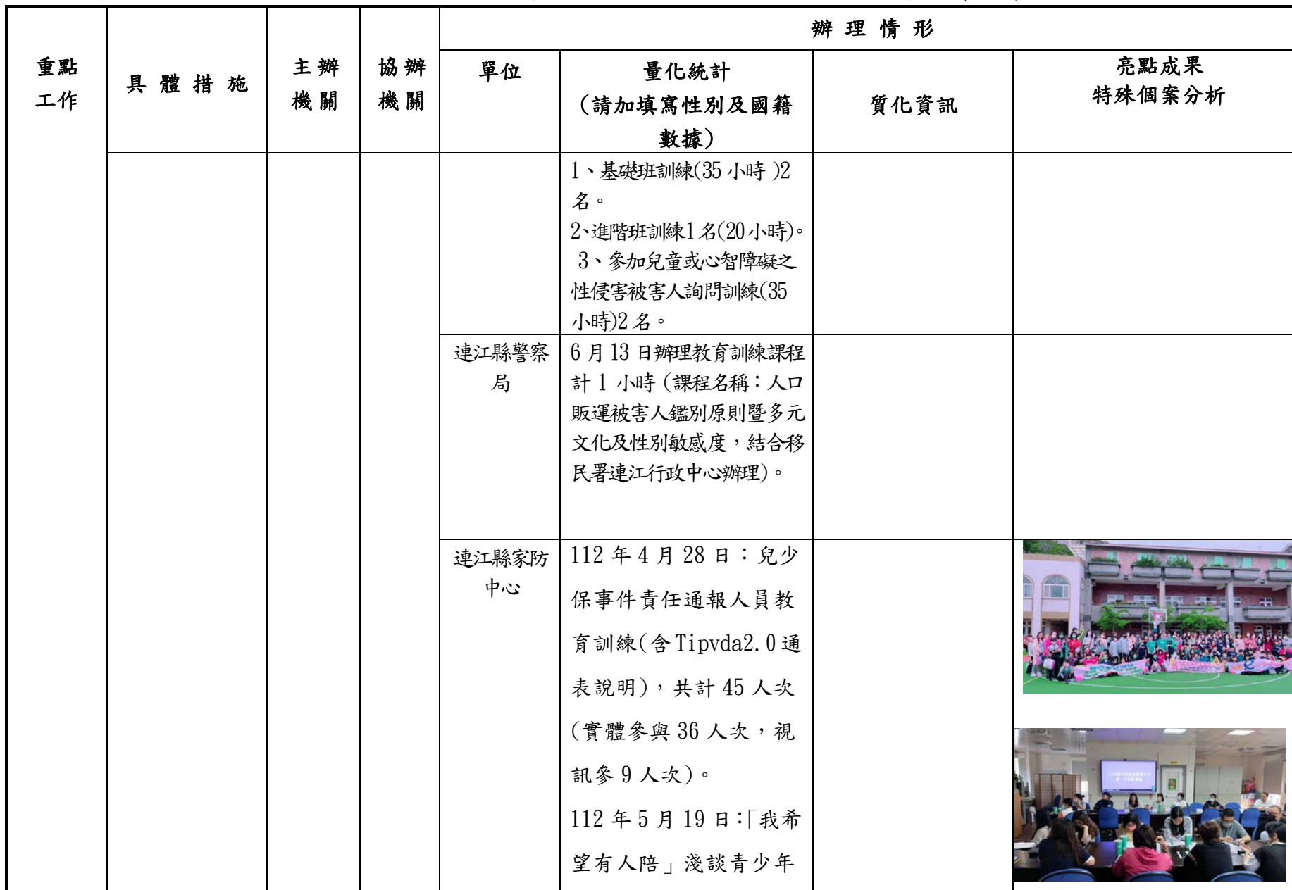
連江縣政府 112 年 1 至 6 月新住民照顧服務措施辦理情形彙整表