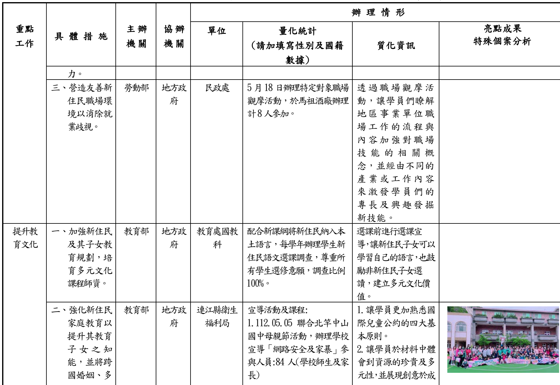
連江縣政府 112 年 1 至 6 月新住民照顧服務措施辦理情形彙整表