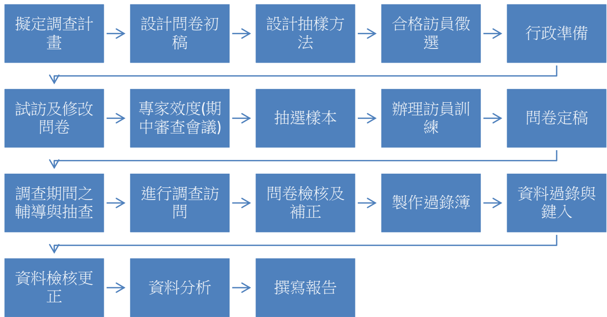
圖 3-2 本調查的基本流程圖