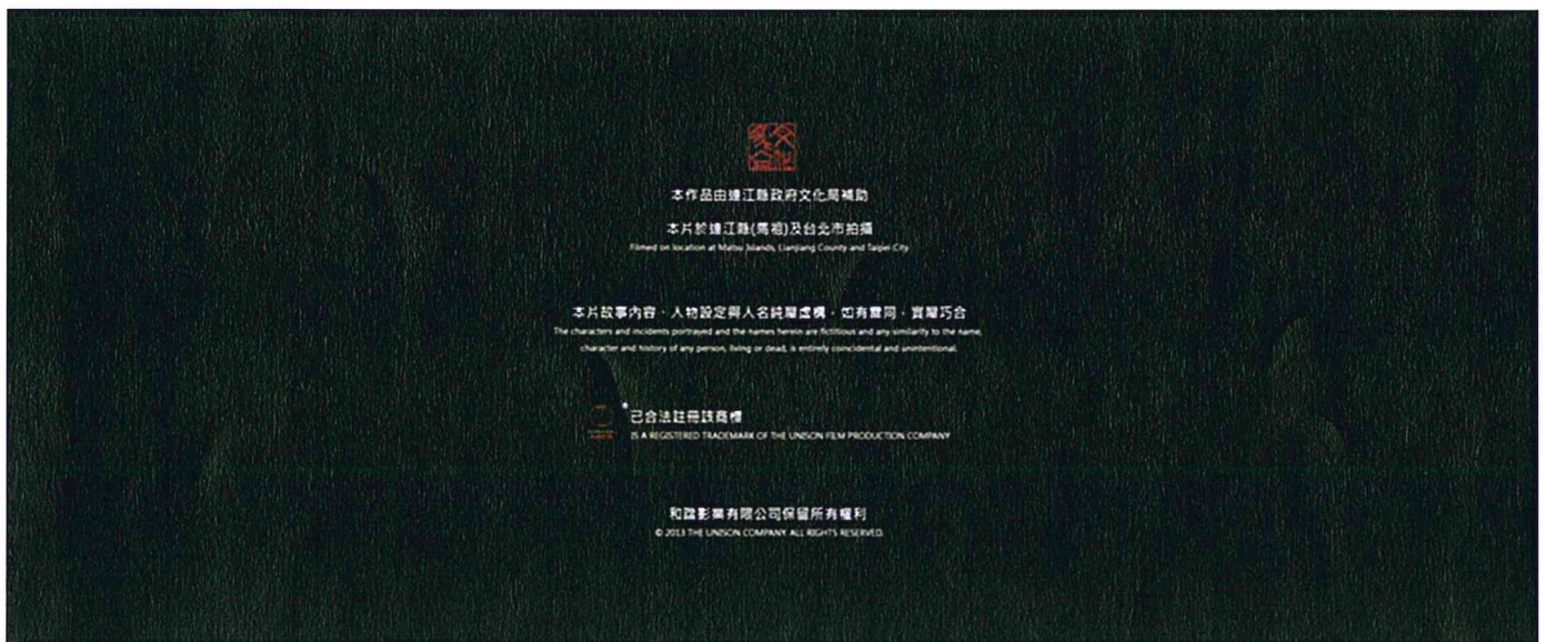
(5) 電影片尾連江縣政府文化局logo