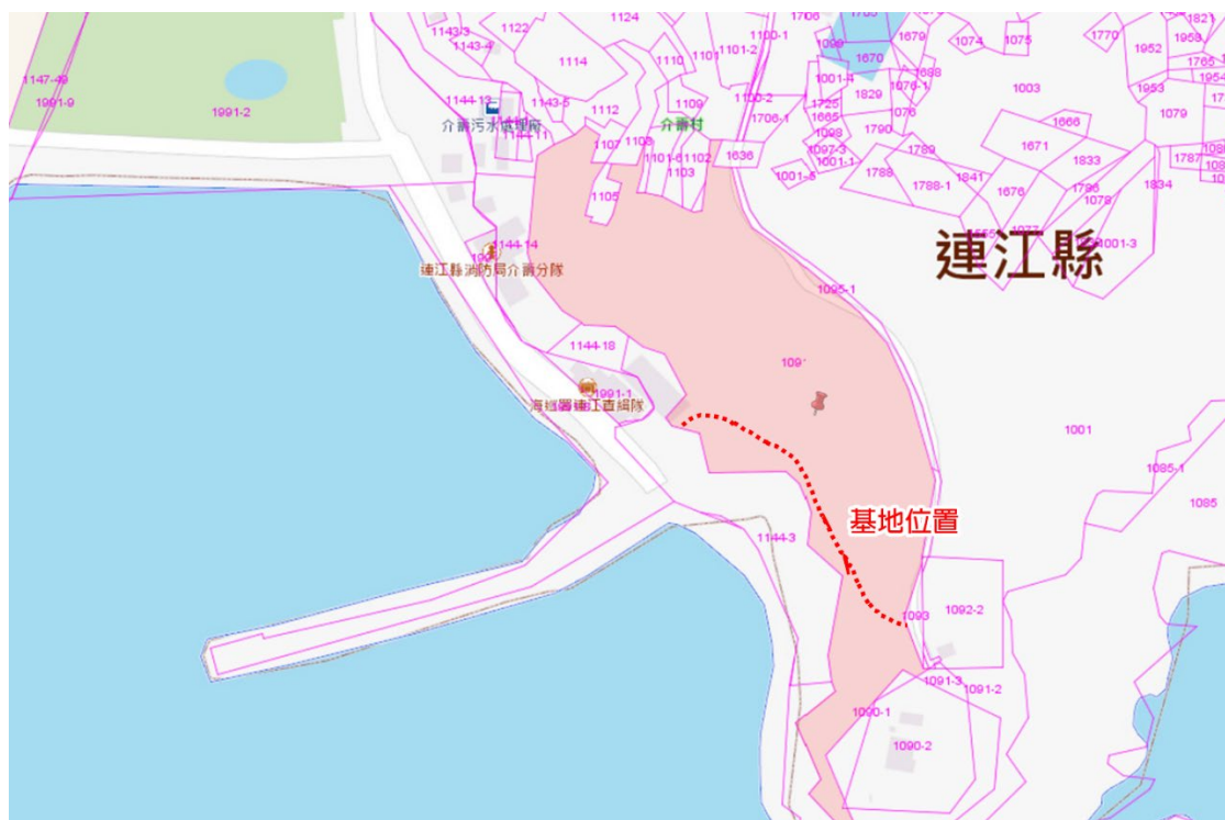
△計畫基地位置地籍圖