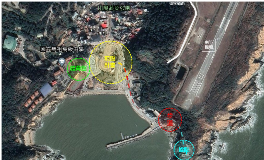
△計畫周邊區域串聯構想圖

為串聯上位計畫「前瞻連江·城鎮之心」及「兩六據點活化工程」，規劃區域為兩六據點至介壽海堤端，以新建濱海觀景步道，目標以串聯遊憩景區打造島嶼旅遊環線為主。