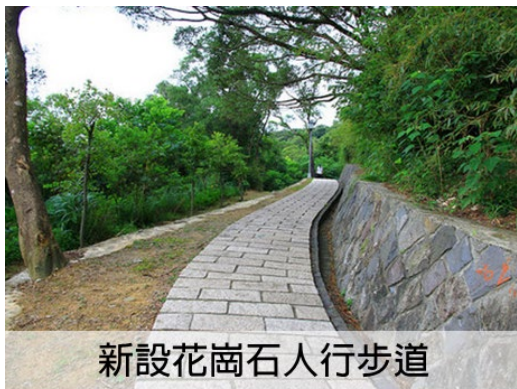
新設花崗石人行步道