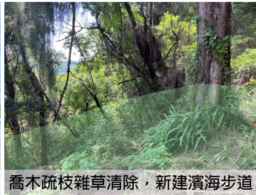
喬木疏枝雜草清除，新建濱海步道