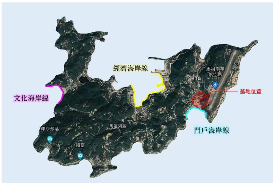
△南竿鄉三大海岸線發展帶

南竿鄉於四面環海的環境下，發展出3條海岸發展帶—「經濟海岸線」、「文化海岸線」及「門戶海岸線」，其中本計畫基地座落於門戶海岸線週邊，介壽村為南竿島重要人流匯集地及商業集中區，藉由改善步道景區環境，深刻形塑門戶海岸提升島嶼發展，成為南竿鄉景觀新據點。