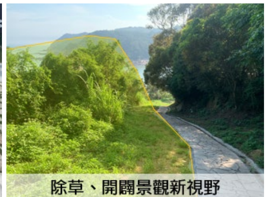
除草、開闢景觀新視野