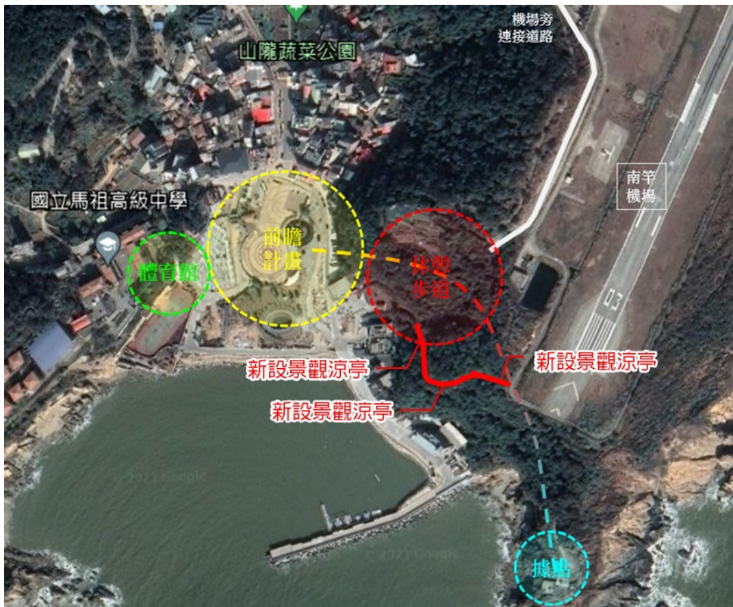
△計畫周邊區域串聯構想圖

透過本計畫將連江縣東側待開發途經總長約95公尺，拓寬步道路幅及設置擋土牆，並於沿線栽種喬、灌木及設置景觀照明予以活化，注入26據點戰地特徵期以「戰備車轍道」型式規劃；於步道沿線及周邊平台環境種植開花樹種如櫻花等活化區域環境生態，以「植栽」為引導串聯路徑美化區域，同時探索馬祖地區戰地風情，提升環境整體景觀及休閒遊憩等寓意，賦予登山步道更增添活動性質，多樣化馬祖地區旅遊目的。