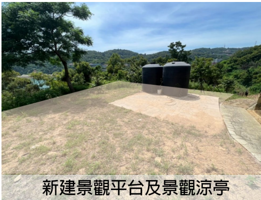
新建景觀平台及景觀涼亭

既有步道拓寬以馬祖地區特色「戰備車轍道」型式，將環境沿線重新改造，賦予其景觀區域亮點，供居民及遊客散步遊憩，並串聯馬祖環島步道特性，眺望澳口濱海風情及鳥瞰戰地休閒全區整體環境；於景區中間端點設置休憩景觀平台，考量邊坡水土保持於上邊坡處增設 RC 擋土牆，並於步道沿線及整體環境種植櫻花，強化景觀美化及安全性。