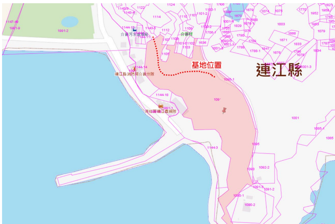
△計畫基地位置地籍圖