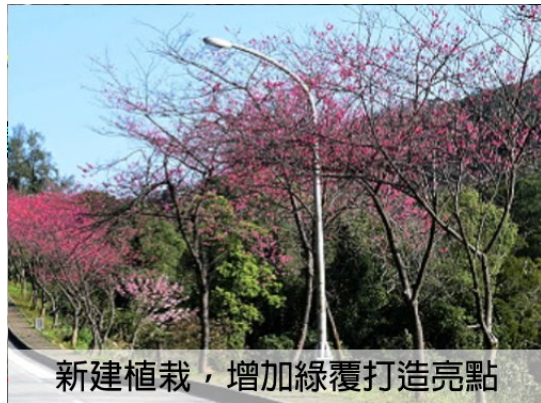
新建植栽，增加綠覆打造亮點