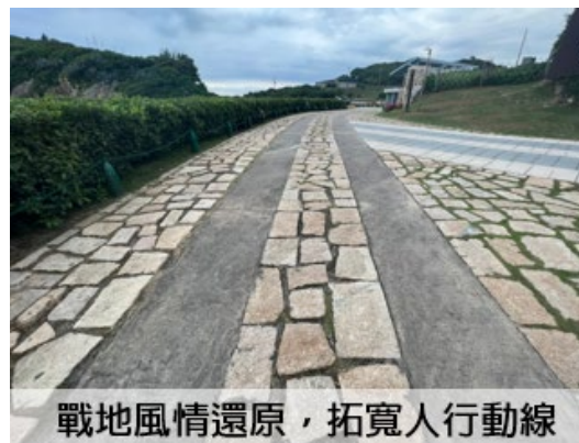
戰地風情還原，拓寬人行動線