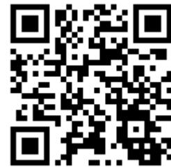
國立空中大學推廣教育中心 臉書粉絲專頁 QR Code